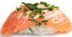
29 Salmone scottato, erba cipollina e sesamo