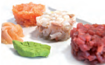
41 Tris di tartare ( tonno, salmone e pesce bianco )