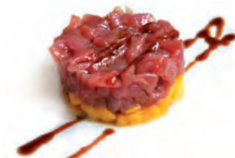
38 Tonno e mango