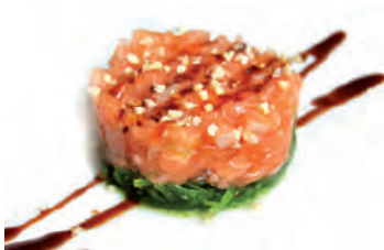
39 Salmone, alghe e mandorle