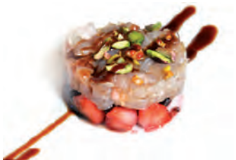
40 Branzino, pistacchi e frutti di bosco